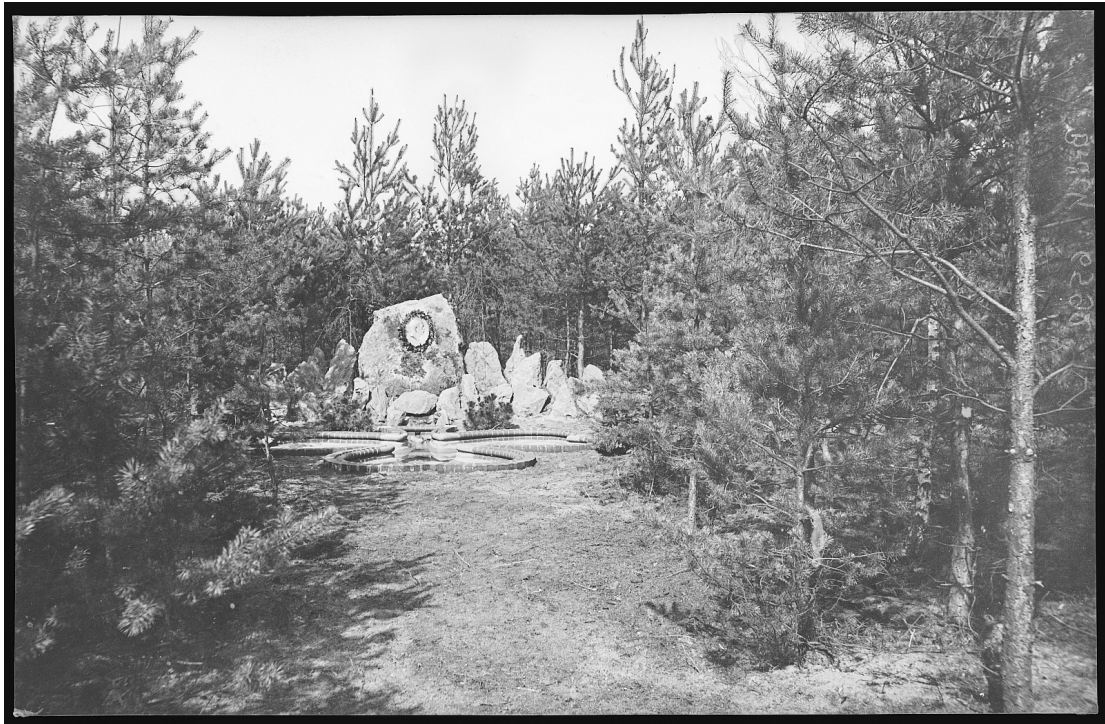
Bismarck-Quelle, höchstwahrscheinlich im Waldpark Radebeul-Ost (Abbildung um 1905)