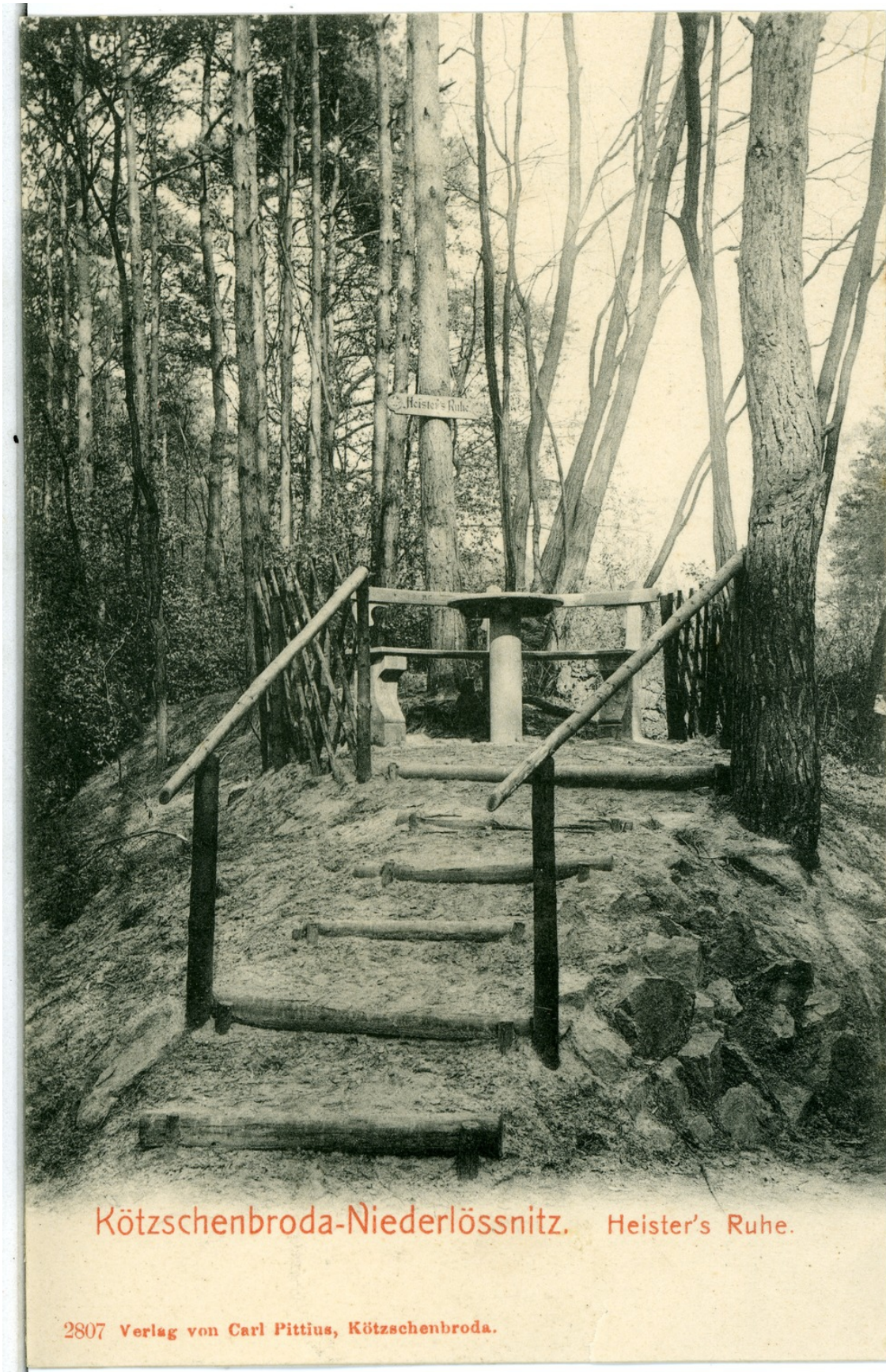
Aufenthaltsplatz „Heisters Ruhe“ bzw. „Pilgrimsplätzchen“ im Süden des Waldparks (Postkarte von 1903)