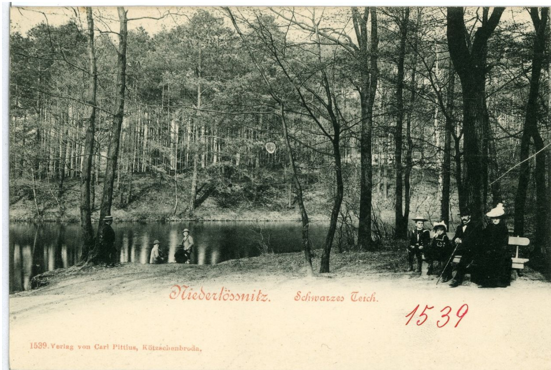
Schwarzes Teich im Nord-Osten des Waldparks (Postkarte um 1901)