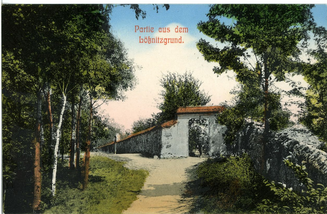
Eingang zum Aussichtspunkt „Friedrich-August-Höhe“ am Wasserturm im Waldpark (Postkarte von 1910)