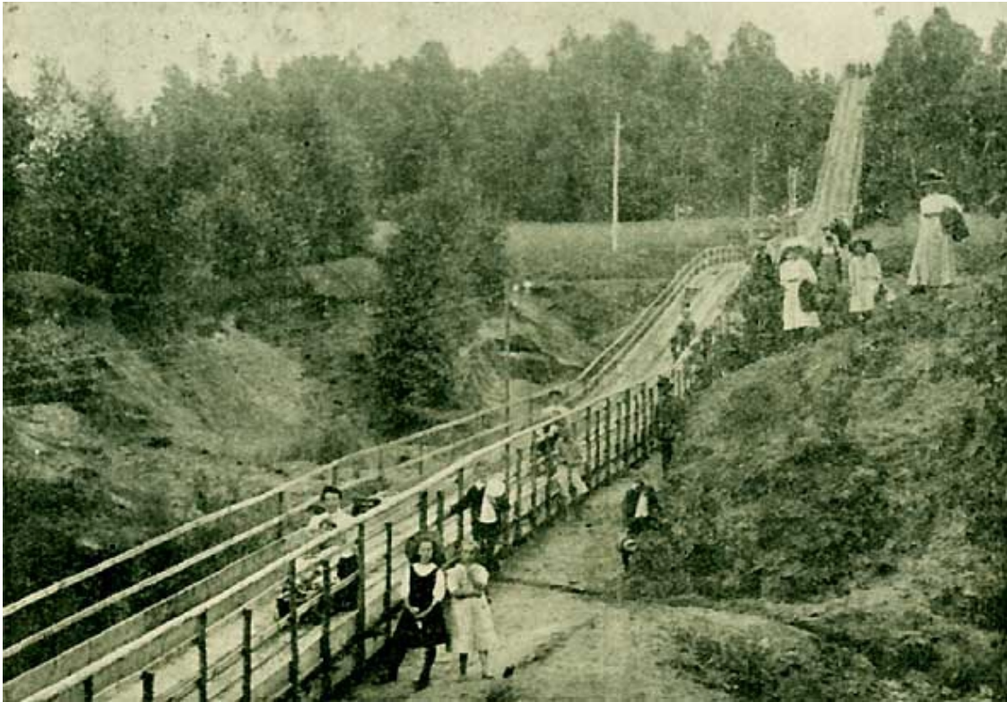
Jyrichs Riesen-Rodelbahn auf dem Gelände des Waldparks Radebeul-West (Abbildung um 1911)