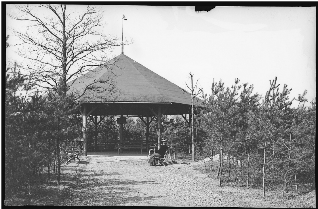
Schutzhütte, wahrscheinlich im Waldpark Radebeul-Ost (Abbildung um 1905)

Aufgestellt: Meike Bornschein M.Sc. Landschaftsarchitektur Dresden, 23.03.2020