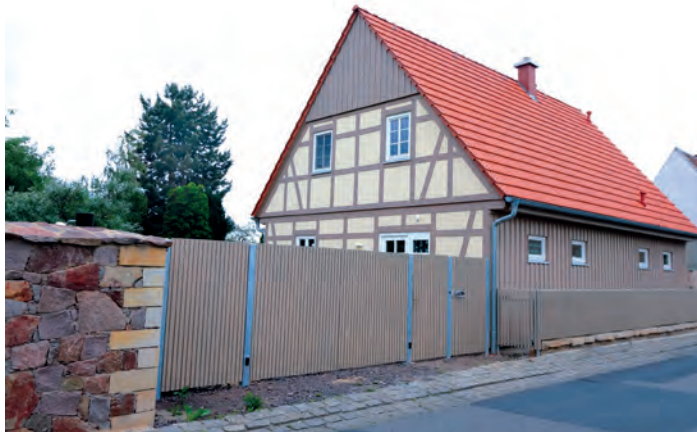
Straßenansicht Serkowitzer Straße 16