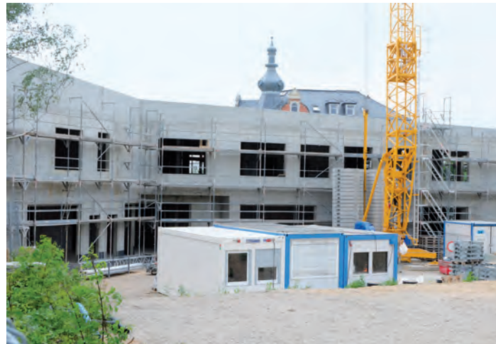
Der Rohbau von der Gartenseite

Leichte Verzögerungen gebe es lediglich wegen des kurzfristigen Ausfalls von Mitarbeitern der Baufirmen wegen der Corona-Krise. Zudem mussten die Kranarbeiten im Frühjahr wegen starken Windes unterbrochen werden. Nach der Fertigstellung