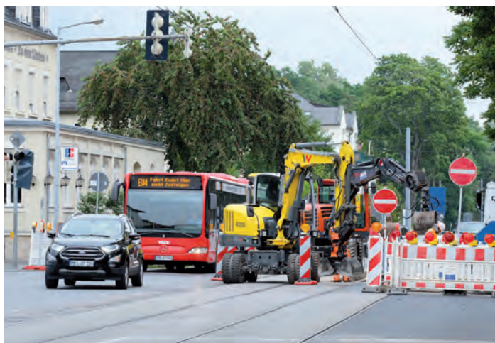
Die Baustellen erforderten einseitige Straßensperrungen.

■ Nach der Freigabe der Meißner Straße zwischen den Landesbühnen und der Dr. Külz-Straße Anfang Juli richten die Planer ihre Blicke auf den nächsten Abschnitt. Dieser betrifft dann Radebeul-Ost, denn auch zwischen der Schillerstraße (Wendeschleife) und der Eduard-Bilz-Straße muss die Hauptverkehrsader von Grund auf saniert werden. Sobald die Landesdirektion Sachsen dem Planfeststellungsbeschluss grünes Licht