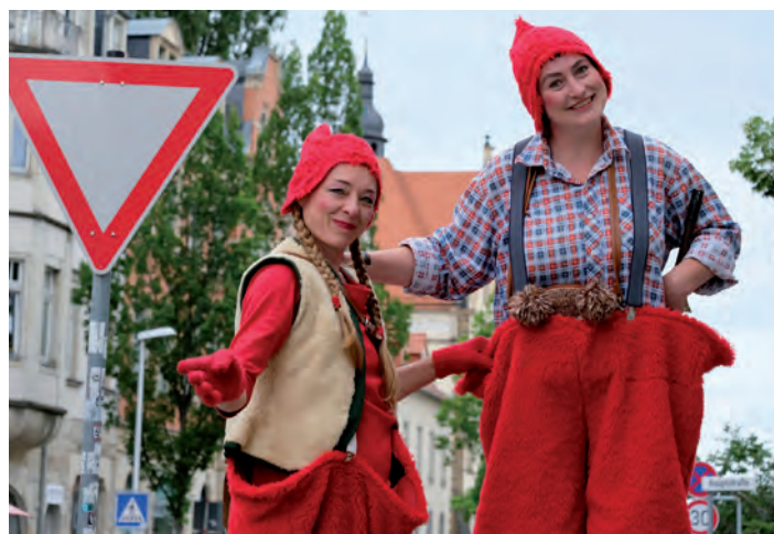
Diese Stelzenkünstler hatten den besten Überblick und wiesen Besuchern den Weg.

Vor dem Radebeuler Kultur-Bahnhof traten Straßenkünstler und auch die Landesbühnen Sachsen auf. Umrahmt wurden die Veranstaltungen von einem Weinboulevard auf der Hauptstraße, den die Radebeuler reichlich nutzten, um gemütliche Stunden gemeinsam zu verbringen.