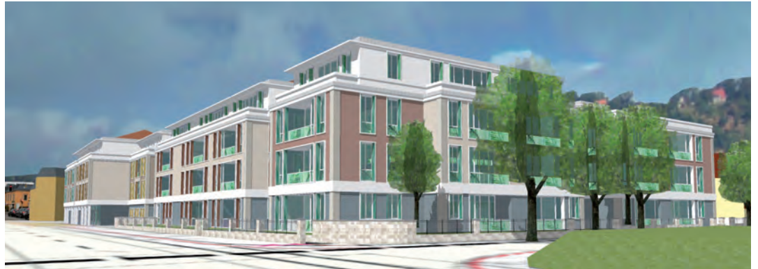
Die WG Löbnitz baut den Gebäudeteil Ecke Meißner Straße/Freiligrathstraße.