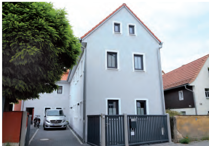
Straßenansicht Kaditzer Straße 12