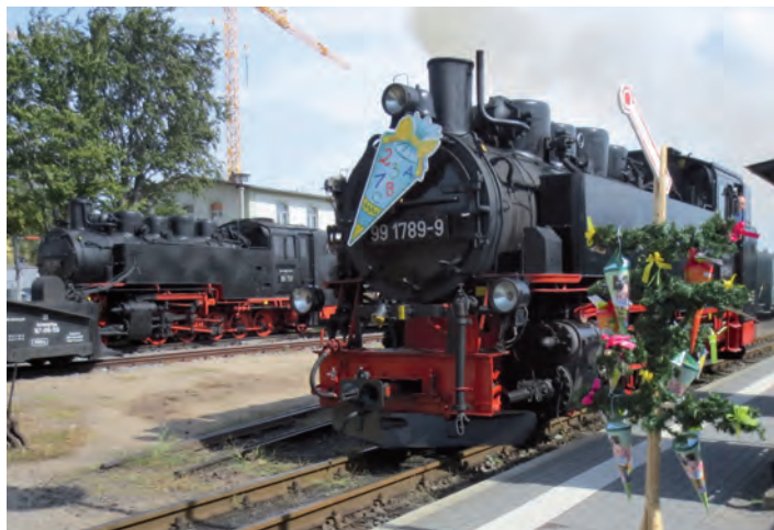
Zuckertütenfahrt mit der Lößnitzgrundbahn

Sa, 5. / Sa, 12. September, jeweils 17.00 Uhr Federweißer-Dampfzug