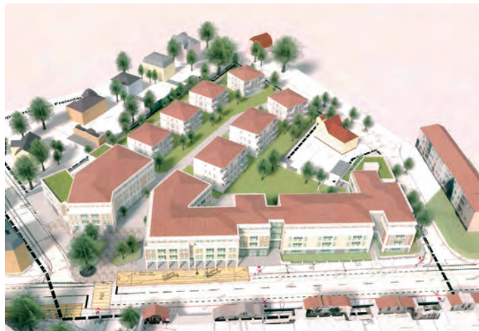
Alle anderen Gebäude errichtet die SWG. Die Tiefgarageneinfahrt erfolgt über die Hauptstraße, die Ausfahrt über die Freiligrathstraße.

und mehr 2- und 3-Raum-Wohnungen – in Summe sind es jetzt 39 Wohneinheiten. Alle Wohnungen werden hochwertig, barrierefrei und nach den neuesten Standards ausgestattet sein, beispielsweise mit Datendosen für schnelles Internet in jedem Zimmer. Und zu jeder Wohnung gibt es einen Keller und einen Tiefgaragenstellplatz.