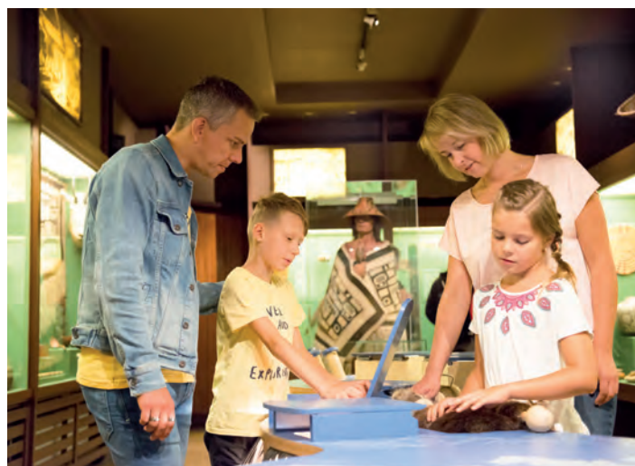
Kinderaktivstation im Karl-May-Museum

Do, 3. September, 19.30 Uhr Autorenlesung: